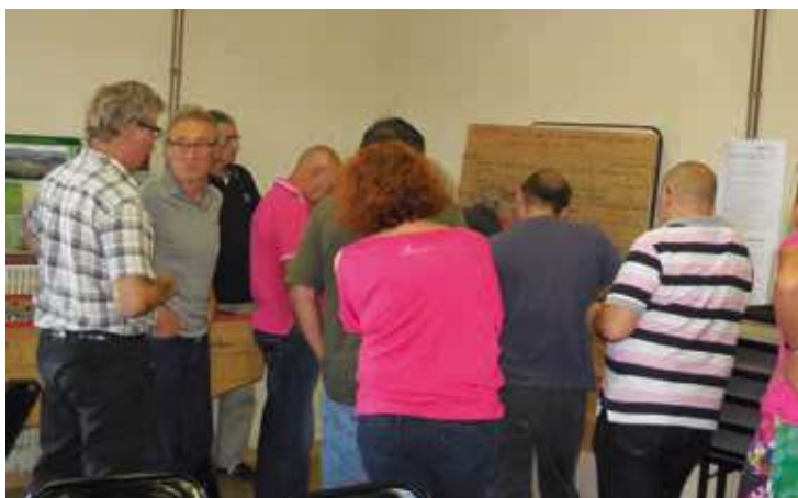
Photographie 2: Priorisation des enjeux par les membres du comité de pilotage (02/09/14)

C'est au cours du 3ème comité de pilotage de la Charte Forestière de la vallée de l'Agly, qui s'est déroulé le 2 septembre 2014, que les orientations stratégiques ont été validées et les enjeux priorités. Ils constituent la base de réflexion du plan pluriannuel d'actions de la Charte Forestière de la vallée de l'Agly.