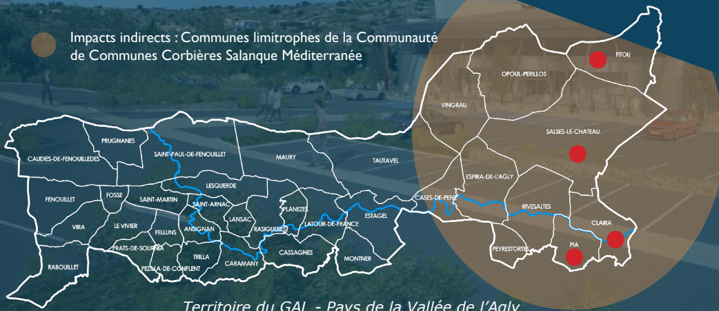
Territoire du GAL - Pays de la Vallée de l'Agly

● Impacts indirects : Communes limitrophes de la Communauté de Communes Corbières Salanque Méditerranée