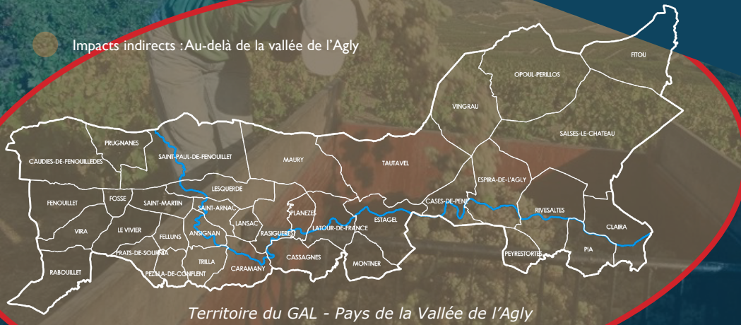
Territoire du GAL - Pays de la Vallée de l'Agly

● Impacts indirects : Au-delà de la vallée de l'Agly