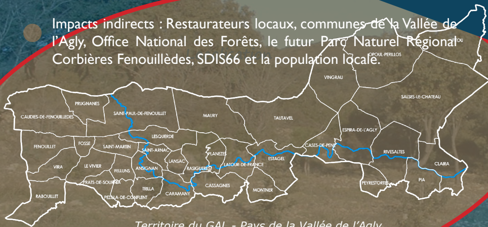
Territoire du GAL - Pays de la Vallée de l'Agly

Impacts indirects : Restaurateurs locaux, communes de la Vallée de l'Agly, Office National des Forêts, le futur Parc Naturel Régional du Corbières Fenouillèdes, SDIS66 et la population locale.