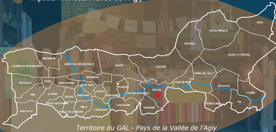
Territoire du GAL - Pays de la Vallée de l'Agly