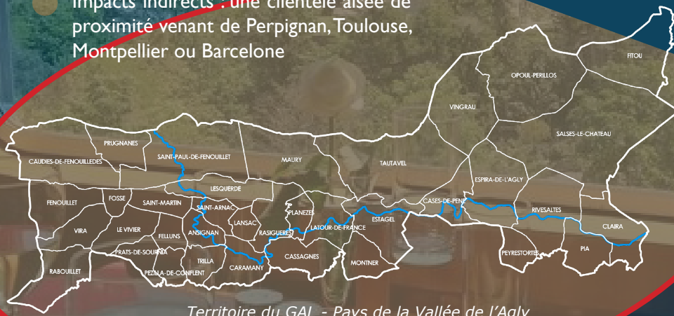
Territoire du GAL - Pays de la Vallée de l'Agly