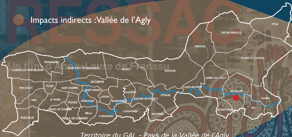
Territoire du GAL - Pays de la Vallée de l'Agly