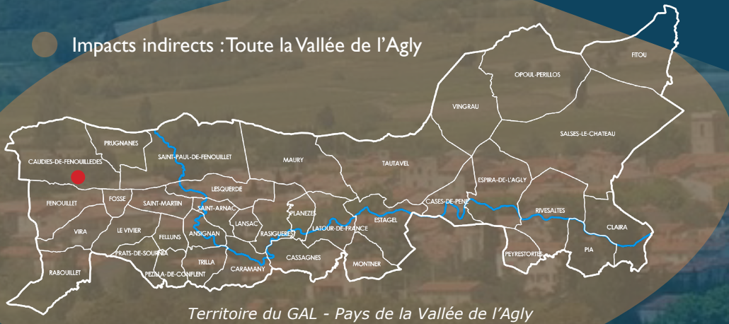
Territoire du GAL - Pays de la Vallée de l'Agly

● Impacts indirects : Toute la Vallée de l'Agly