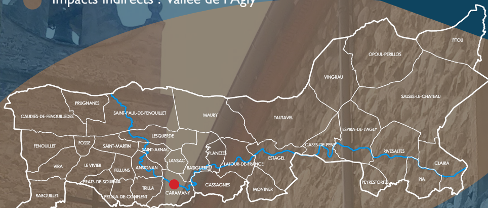
Territoire du GAL - Pays de la Vallée de l'Agly